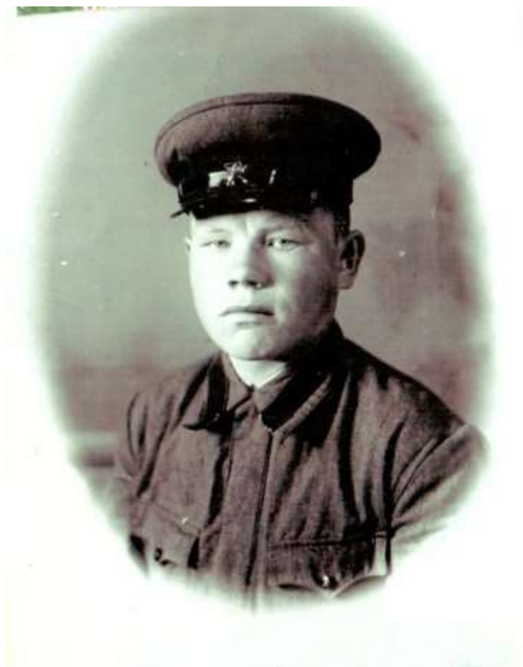
фото 1941 года.