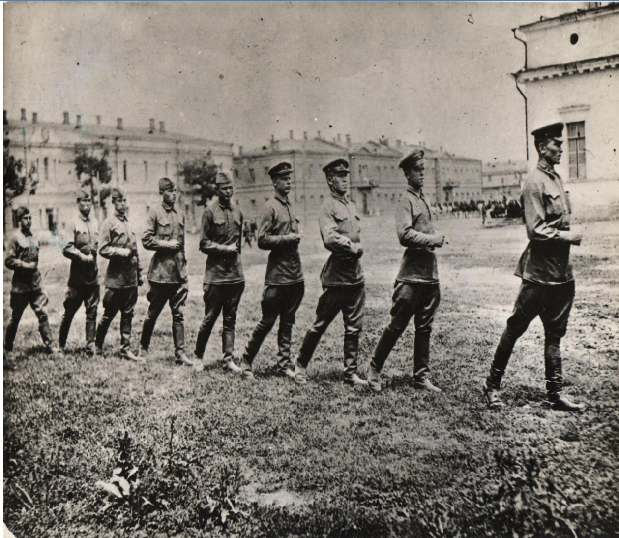
(Строевая подготовка, четвёртый справа)