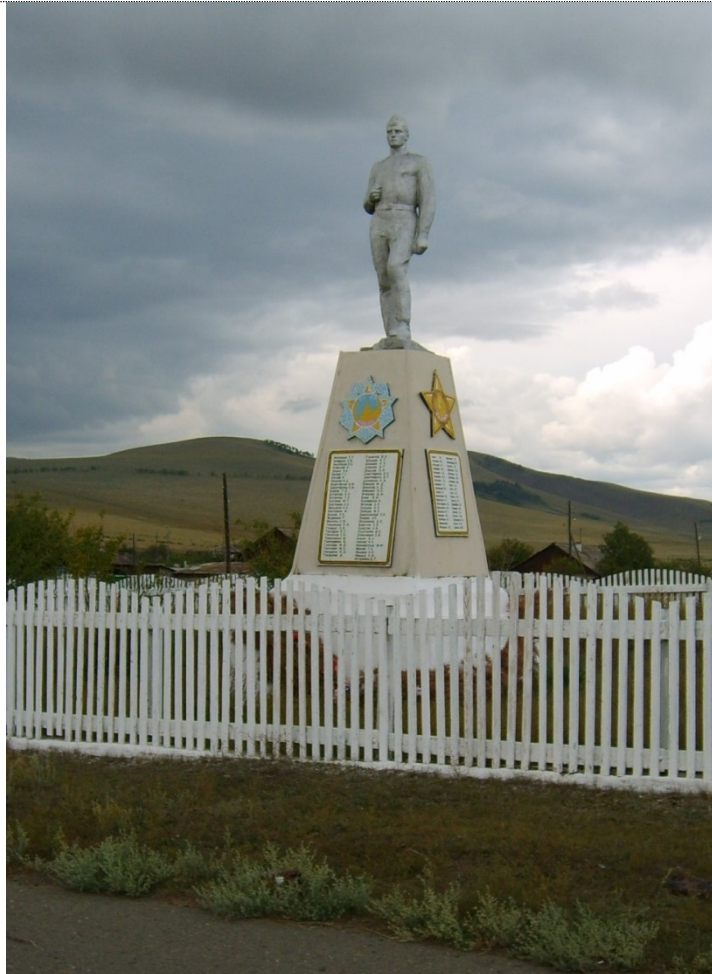
Памятник в селе. 2008 г.