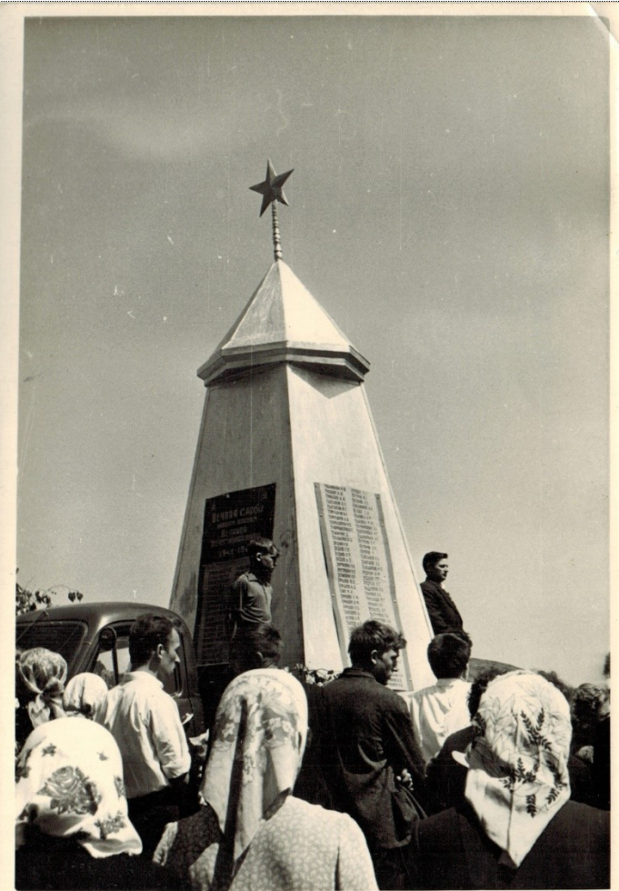
Установка и открытие памятника (год неизвестен)